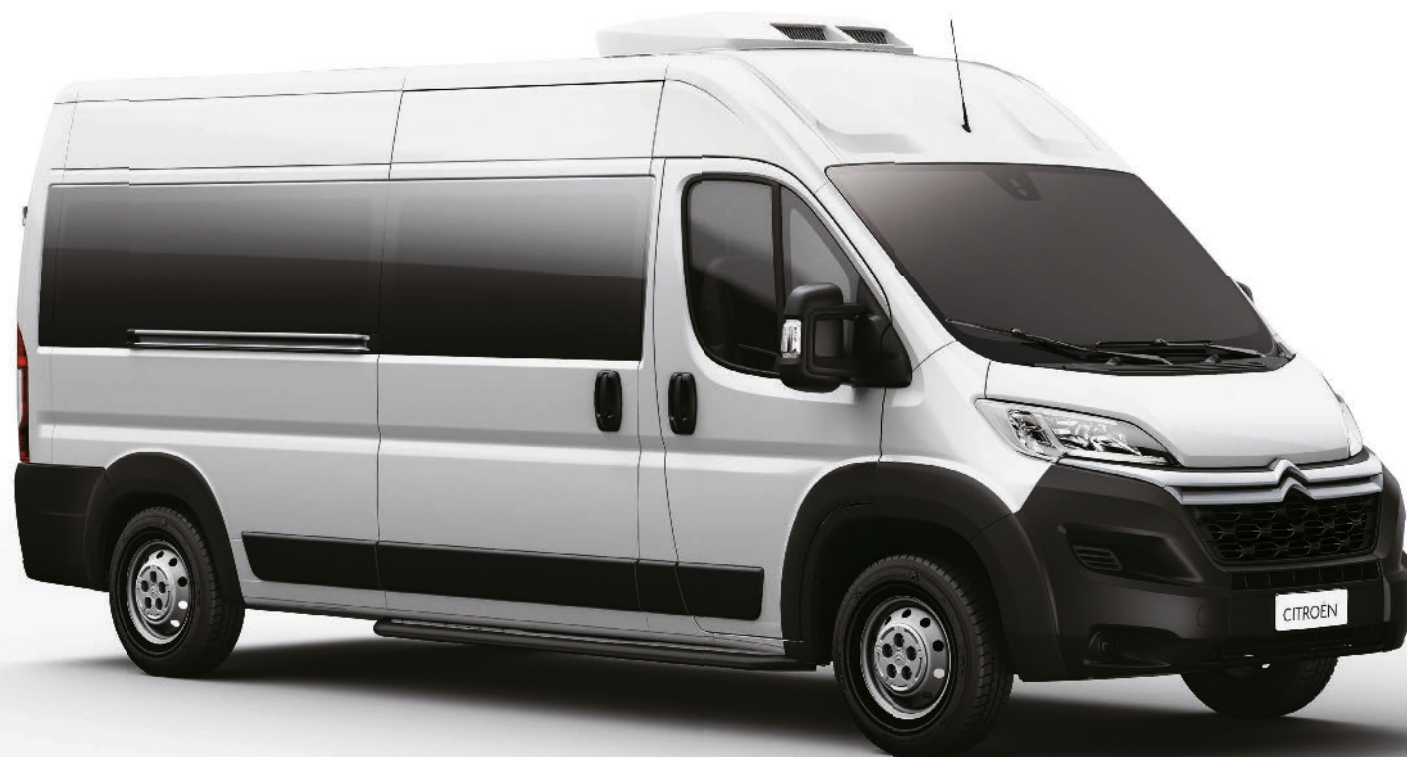
CITROËN JUMPER MINIBUS